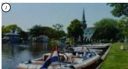
gezichtsscherpte 100% gezichtsveld 175 graden

Een deelnemer kan bijvoorbeeld een redelijke gezichtsscherpte hebben met een klein gezichtsveld (foto 3). Voorbeelden komen uit het boek '+23' door Annemiek van Munster, uitgave van Stichting Zicht in Zicht.