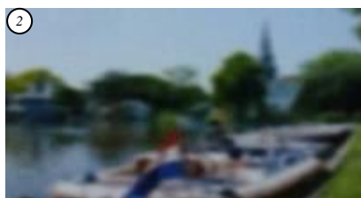
gezichtsscherpte laag gezichtsveld 175 graden